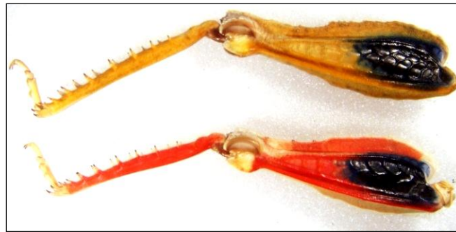
Figure 1. Face interne des fémurs postérieurs de T. cisti hirtus (en bas) et T. cisti clavelii (en haut) Figure 1. Inner side of hind femora of T. cisti hirtus (down) et T. cisti clavelii (up)

Localité type : Gabès (Tunisie littorale).