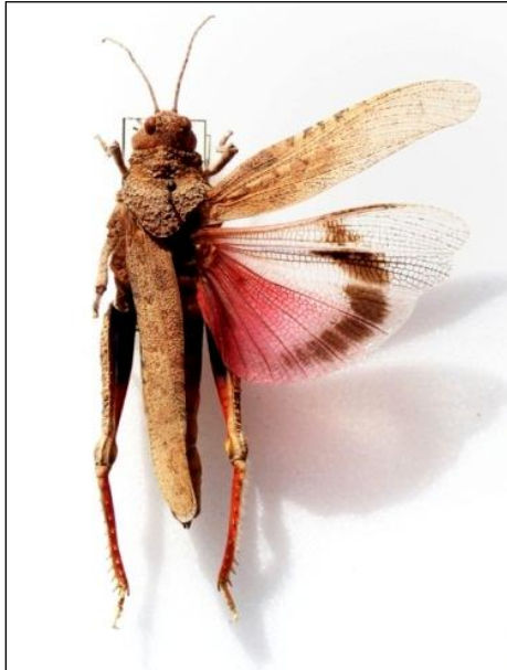
Figure 3. Tmethis cisti hirtus , femelle