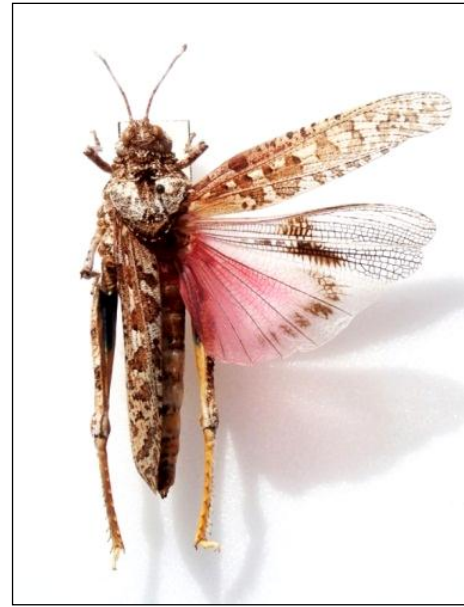
Figure 4. Tmethis cisti clavelii , femelle